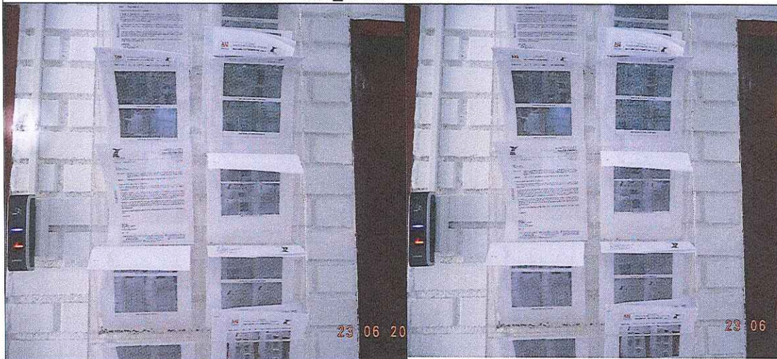
EDICTOS DE LA R_17477 YC-CRT-56699